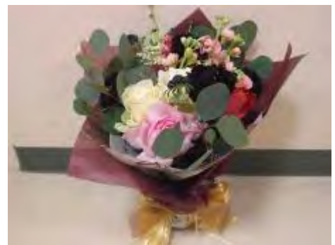
ラッピングをしてリボンをついたら完成