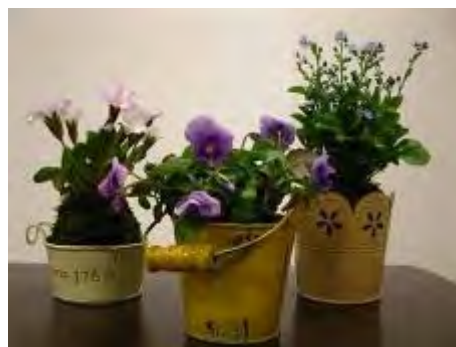
色々な組み合わせで素敵な作品が完成