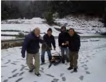
雪の中、竹を切り出し運びました。

「わたしの木」の活動のなかで、福岡市水道局との共働事業「わたしの木ゾーン」活動が環境保全のテーマとして最適と考え、この活動の楽しい体験を率直に伝え、昨年の暮れに作った入部公民館の門松の美しさを伝える体験講座を試みました。