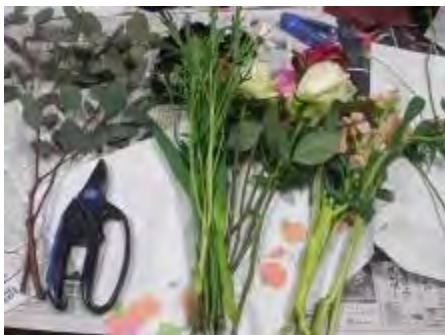
下の葉を取り除き同じ長さに切り揃えます

茶系とワインレッドのラッピングペーパーを使った包み方も、上・下に分かれる方法を使いました。プラス3種類のリボンを組み合わせて完成です。ラッピングの仕方や、リボンの作り方を学ぶチャンスがありませんので、今回始めて…という方が多く、「難しい」という声がありましたが、出来上がりの素晴らしさに大変喜んでいただきました。