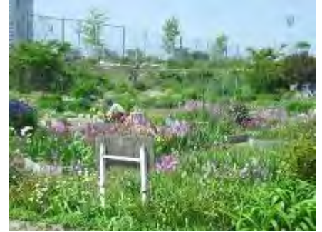
担当の区画はそれぞれが手入れしています

1月には毎年「どんど焼き」があると聞いて行ってみました。道路には地域の方が出て安全に渡れるように誘導され、老若男女の皆さんがぞくぞくと集まってきました。