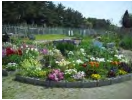
色とりどりの花が咲いた春の花壇