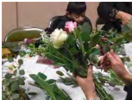
茎が同じ方向になるように素早くまとめます