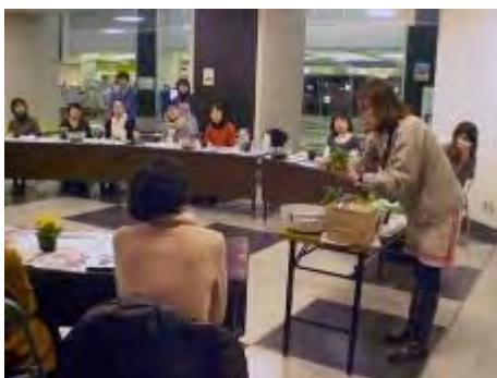
まず講師が作品を作ってみます