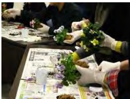
それぞれに好きな花で作ります