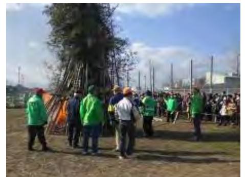
どんど焼き 多くの住民が見守るなか点火