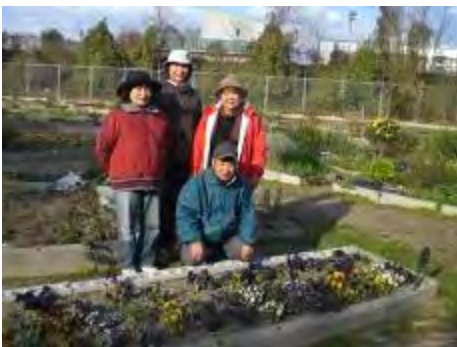
会員のみなさんです 中央が府後会長

この地域はマンションが次々と建ち、住民はどんどん増えています。住民が一体になって安全・安心な街づくりをめざし、活気がある街づくりに貢献されているのが伝わってきました。