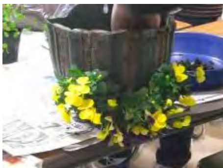
一番下のビオラは下向きに入れます