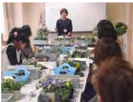
本日植える花の特徴、植え方を説明

器は特別に作ってもらった木のプランターに、淡いブルーを塗ってもらい市販の器とは一味違ったものにしました。まず、机の上で10ポット近い苗を並べてみましたが、こんなに沢山の苗が器に入ってしまうのか皆さん心配されましたが、スタッフが一人一人丁寧に指導し、きれいに植え付ける事ができました。