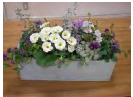
春らしい素敵な作品が完成