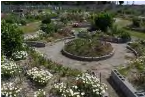
センター花壇の周りに放射状にデザインされた広大な花壇

香椎浜に「あいたか橋」が出来てからはウォーキングコースになり、多くの方が花壇を見に来てくれるようになりました。