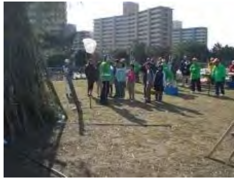
どんど焼き 小学生が今年目標を発表