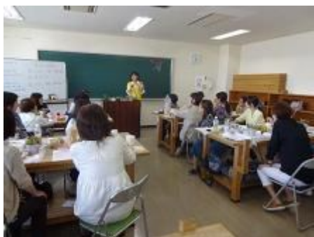
多肉植物の育て方について多くの質問がありました。

質問タイムでは、徒長した多肉植物の植え替え方法や、そこ穴がない器での管理の仕方などの質問があり、実際に徒長した植物や器を使って説明しました。