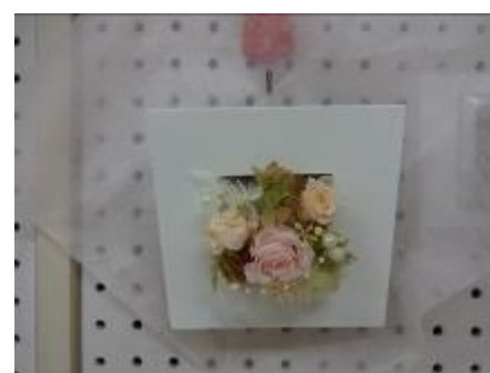
白いフレームにピンクと白いバラを挿した作品