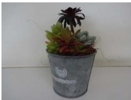
ブリキの器を使った作品