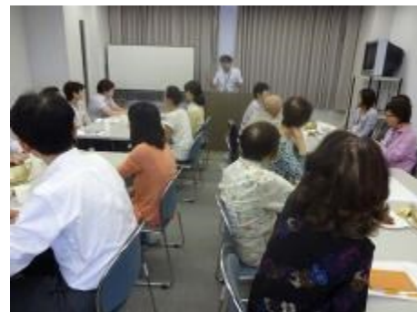
意見交換会の進め方を説明

和やかな中にも活発な意見が飛び交い、大変有意義な意見交換会になりました。お一人お一人から貴重なご意見をいただき、緑のコーディネーターさんの想いが伝わってきました。その想いを無駄にしないように、今後も緑のコーディネーター・福岡市・緑のまちづくり協会が手を取り合って、花と緑あふれるまちづくりを進めていこうと、身が引き締まる思いでした。