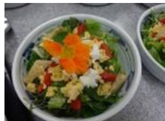
【ミモザサラダ】 葉物野菜に赤ピーマン・ズッキーニ・いり卵等とナスタチュームを飾り、2種類のドレッシングでいただきました