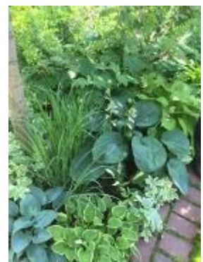
オープンガーデンS邸 シェードガーデン

移動中の車窓から見える、じゃがいも畑・麦畑・白樺・針葉樹。北海道は、長い間雪の下で力を蓄え、雪解け後、暖かい春になって一気に芽をだし花を咲かせます。