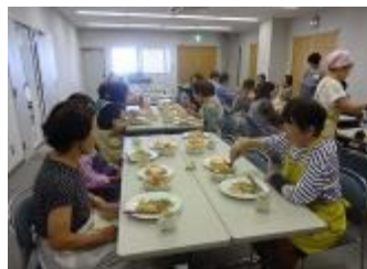
【楽しいお食事会】 「またお願いします」という声が聞かれました。