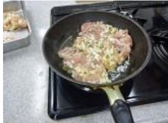
【鶏肉のモロッコ焼き】 鶏もも肉に切り込みを入れ、玉ねぎのみじん切り・ローズマリー・生姜・ニンニク等をはさみオリーブ油で焼きます