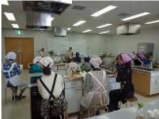
ハーブの基礎知識と、本日の料理の作り方を説明。

みなさん慣れない調理台に苦戦しながらも、和気あいあいと会話ははずみ、ハーブを使った料理が出来上がりました。緑のコーディネーターの皆さまと食事をするのは初めてでしたが、和やかな雰囲気の中会話がはずみ、とても良い交流になりました。 (公財)福岡市緑のまちづくり協会 安重富子