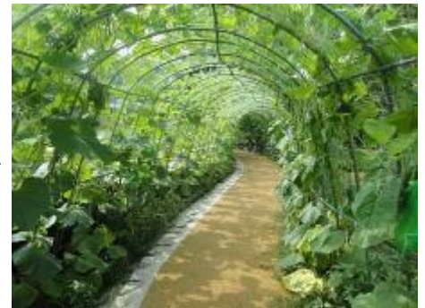
ヒョウタンのトンネル

暑い日が続きますが、植物園に涼みに来てはいかがでしょうか。ぜひお持ちしております。