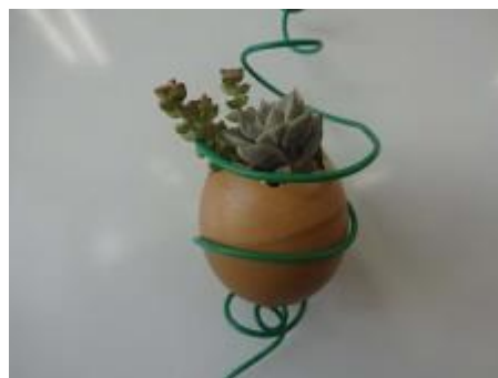
卵のカラを使った作品