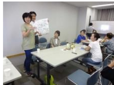
話し合った内容をグループごとに発表