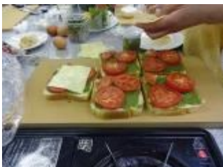
【バジルソースの食パンピザ】 パンにバジルソースをぬり、スライスしたトマト、チーズをのせて焼きます。