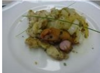
【ウインナーのハーブ焼き】 網目を入れたウインナーに鷹の爪・ニンニクをからませオリーブ油で焼き、パセリ・タイムで香り付けをします。