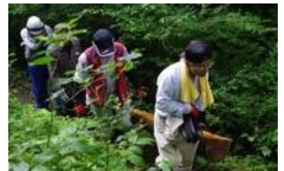
丸太のベンチを担ぎ上げる