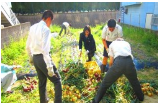
タマネギを収穫する純真高等学校の生徒たち