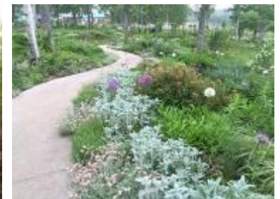
ゆったりとした小道