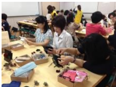
バランスを考えながら挿していきます