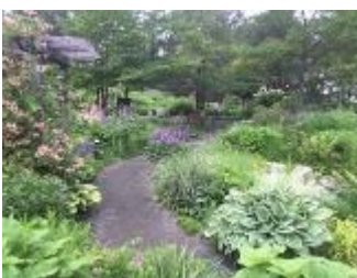
どこまでも続く小道