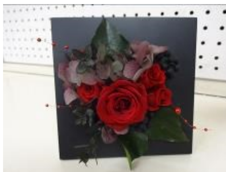
黒いフレームに赤いバラを挿した作品