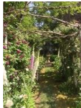
オープンガーデンT邸 白樺で作ったアーチ

最終日は、個人邸を3軒回りました。どこのお宅も、手作りばかりで、それぞれ個性のあるお庭でした。