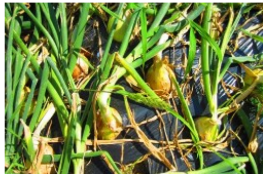
収穫直前のタマネギ