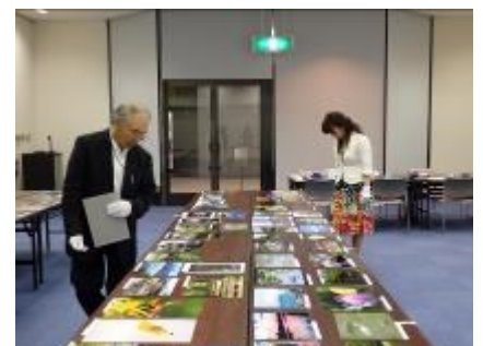
昨年の審査会の様子

ご協力いただける方は、7月31日（金）までに電話、FAX、メールにて下記連絡先までお名前、連絡先をお知らせください。