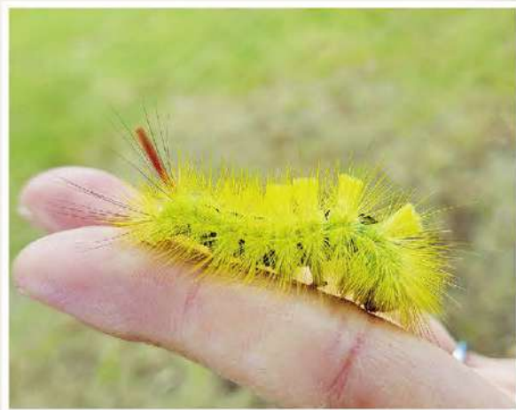
写真はリンゴドクガ

身近なところで見かける毛虫は毒を持っているものが多いが、毛虫全体からするとごく一部。観察会では希望者に触ってもらっている。ごわごわとした感触で天敵の鳥からするとど越しが悪いのかも？