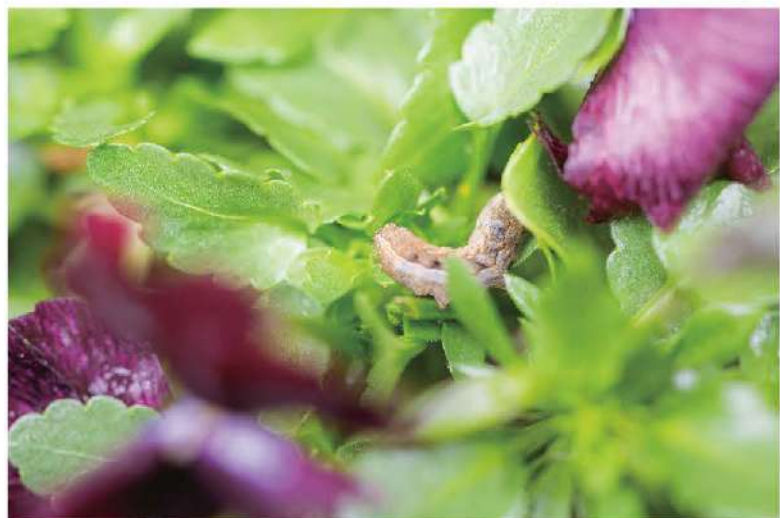
チョウは赤紫や青紫の花を好む。 葉をめくるとハスモンヨトウの幼虫がいた