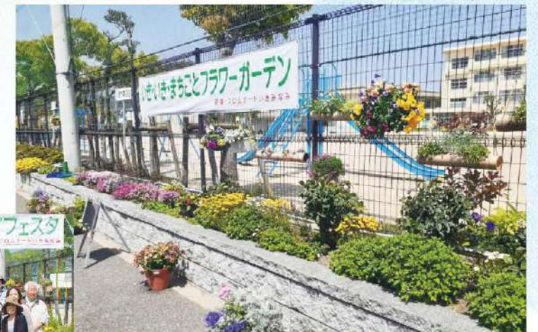
花壇プロムナード・いきみなみ