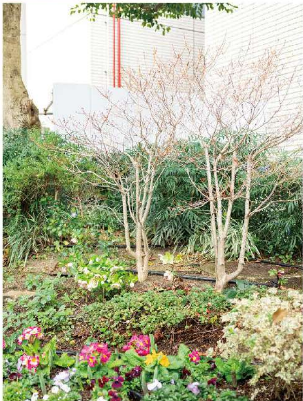
花芽を付けたドウダンツツジ。蜜はチョウたちの好物