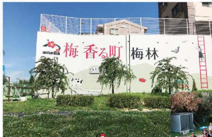
梅香る町梅林推進プロジェクト

地名にちなんだ「梅」をツールに、町の美化を促進する活動を通して地域住民通しのコミュニケーションが深まり、災害時に助け合えるような環境が醸成されることを目的に活動しています。七隈・金山校区15箇所、計118本の植栽が完了。景観美はもちろんのこと、梅見会の開催や景観づくりのプロジェクトを通じた学生の巻き込み方や見せ方、世代をつないで行けるようなエンターテインメント性と運営のセンスが高く評価されました。