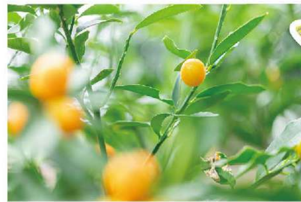
バタフライガーデンに欠かせない、チョウが好きな柑橘系のキンカン