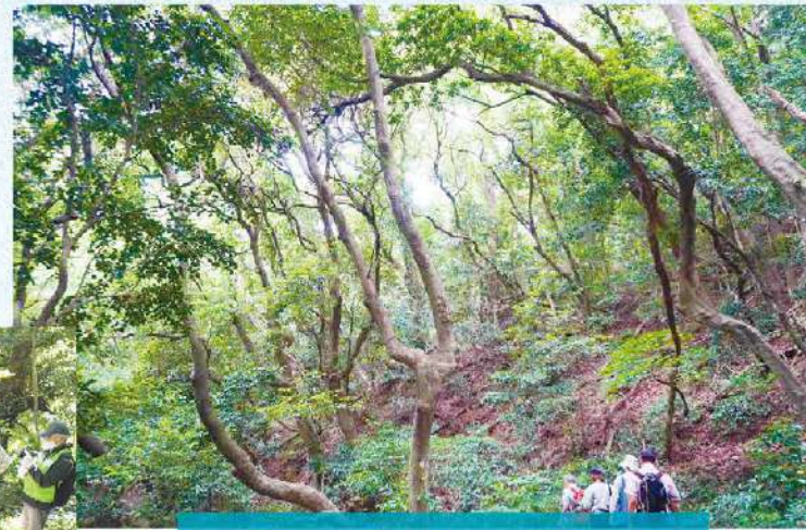
愛宕の森と緑を守る会

愛宕山のこの環境を子々孫々に手渡すことができるよう、これ以上の自然の退行や歴史文化の衰退を抑制し、50年、100年先を見据えた保全をしていくことを目的として活動しています。熱心な整備により竹の侵食を食い止め、広大な森が本来の姿を取り戻しました。また、植物・昆虫観察会や歴史・文化講演会の開催、ツクシヤマザクラ等希少種保全の為の研修会を実施しており、専門性の高さや教育の観点が高く評価されました。