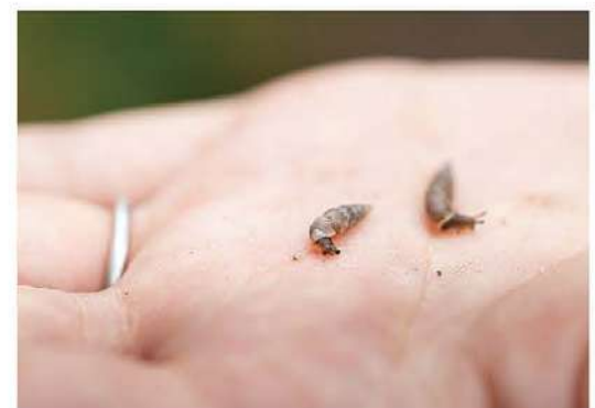
雨が降ると壁などでよく見るキセルガイ。カタツムリの仲間です。小さな触角がある