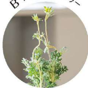
B フランネルフラワー