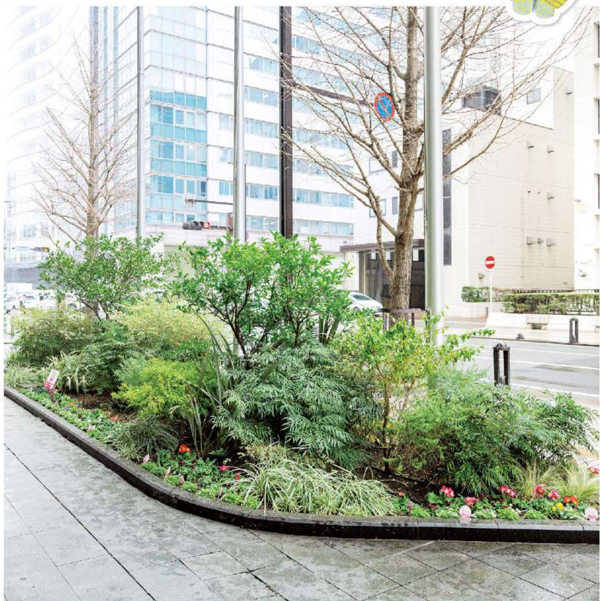
福岡市中央区天神にある 福岡市役所の「花と蝶の憩いの場」

ネイチャーは自然、 ポジティブはプラス、 つまり、簡単に言うとな、 下降し続ける生物多様性の 損失をくいとめて みんなで回復の軌道に 乗せようよ、ということ。