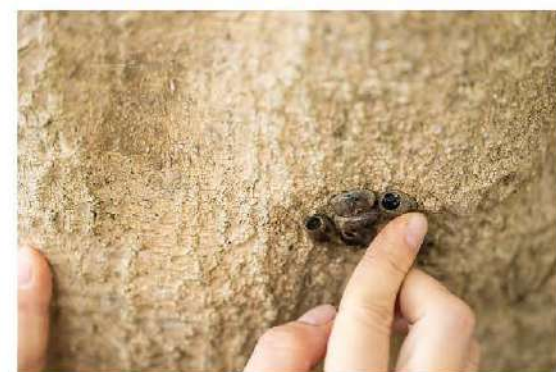
木の節かな?と思ったらイラガの古い繭殻だった