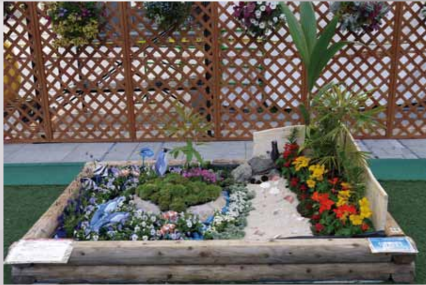
「彩りあふれるハートの街福岡」 Healing forest

穏やかな美しい海、緑あふれる彩りの街・福岡 ハートの島は、市民の心の形 全国に、世界に幸せを発信しましょう!!