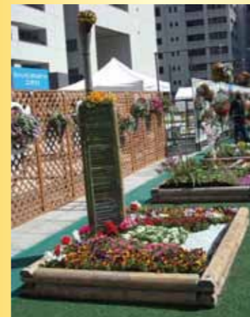
「花と福岡タワー」 野多目5丁目園芸クラブ