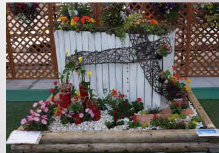
「ようこそ! 花と光が織り成す「誘いの世界」へ」 地域に花を咲かせよう会

福博花しるべで賑わう街-「ふくおか」- インパクトカラーの赤に加え、ビビッドな黄色、緑色、オレンジ色などのビタミンカラーで、色とりどりの花が咲く「元気な福博の街」を表現しました。積み上げた赤色の植木鉢は高層建物。小さなビー玉は、春雨の水滴。 ようこそ! 花と彩と小さな光の彩が織り成す神秘の世界へ。