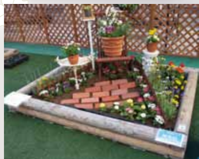
「小鳥のさえずりに誘われて… 春の小径」