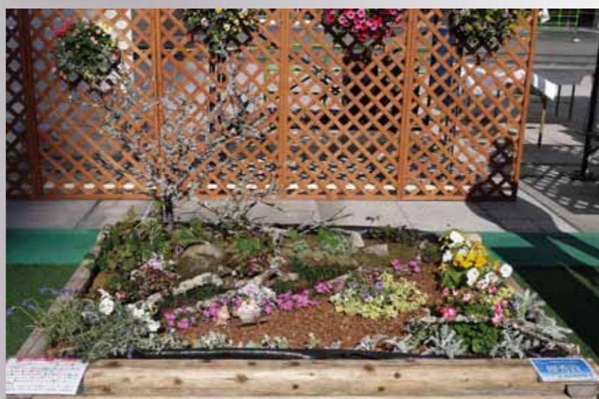
「森の広場」 ローレル花クラブ

ところどころに冬枯れの景色を残しながらも、草や木々は芽吹き、森は緑で明るさを増してきた。 広場では、花も咲き始め、春を待ちわびた森の住人たちが、日だまりで何だか楽しそう。でも心の中では、いつも「東北ガンバレ」とエールを送っている。