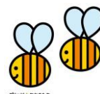
グリッピと仲間たち