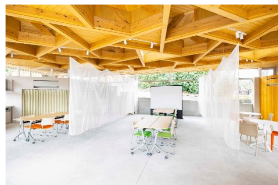
区画はカーテンで仕切ることが可能です。