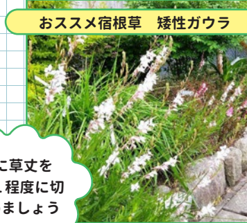
おすすめ宿根草 矮性ガウラ