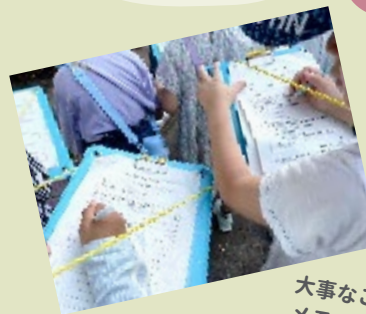
大事なことを メモメモ～