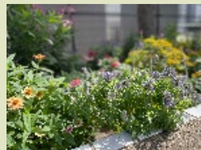
手入れの 行き届いた 素敵な花壇