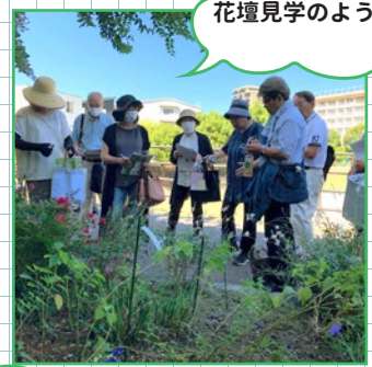
花壇見学のようす