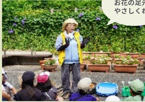
水やりは お花の足元に やさしくね。