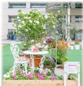
↑ 前回の一人一花スプリングフェス 最優秀賞作品