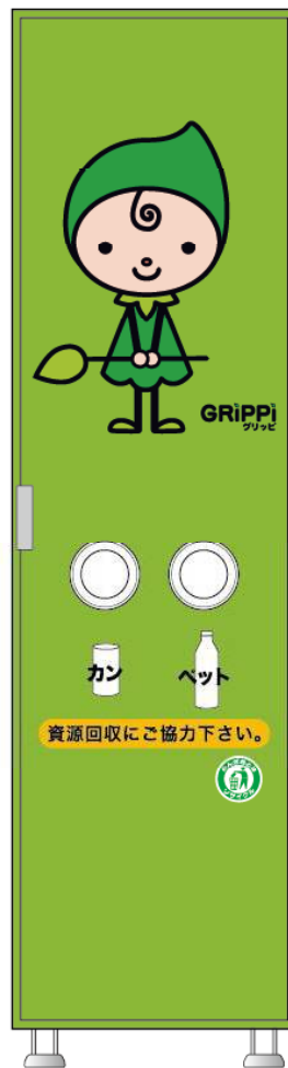
空容器回収ボックス本体