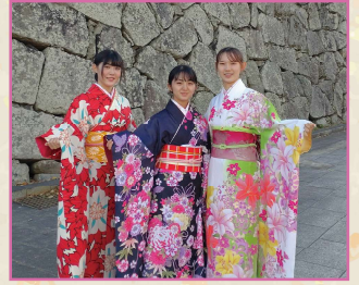
かんたん着物体験