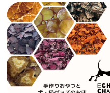
echo chain x bolga baby