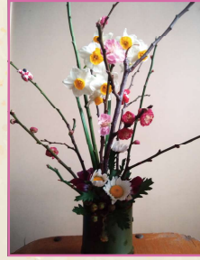
新春アレンジメントの ワークショップ

第一種動物取扱業登録証 福岡城サマライディング/福岡市中央区城内1番 4/展示/宮本いずみ/2024年3月11日~2029 年3月10日/ ※最終受付15:30 ※当日先着順