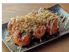
たこ焼き 蛸九/たこびと