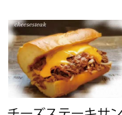
チーズステーキサンド 鏑猫食堂 (22日のみ)