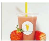
フルーツスムージー 糸島フルーツパーラー