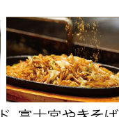
富士宮やきそば シノリ屋 (23日のみ)