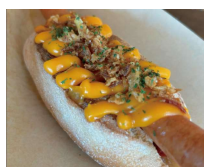
ホットドッグ 5 5 DOG